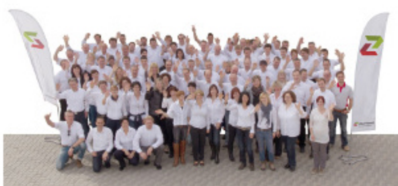
Derzeit zählt das Franchiseunternehmen in Deutschland, Österreich und der Schweiz über 80 Franchisenehmer.

Wer sich für eine Partnerschaft entscheidet, steigt in einen soliden Wachstumsmarkt ein. Dazu trägt unter anderem das ständig zunehmende Sicherheitsbedürfnis von Privatpersonen und Unternehmen bei. Außerdem führt der Wandel in der Landwirtschaft hin zu immer mehr Pferde-, Weide- und